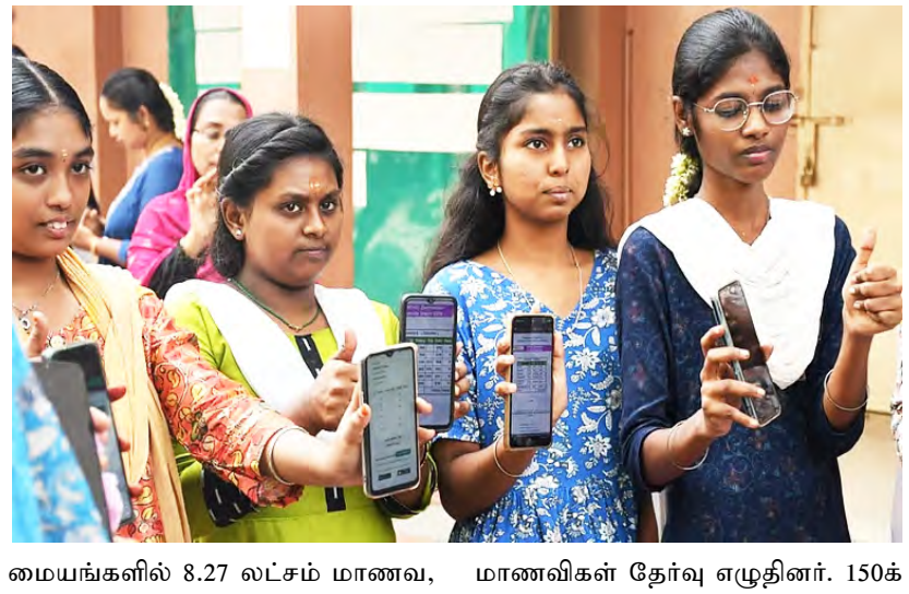
மையங்களில் 8.27 லட்சம் மாணவ, மாணவிகள் தேர்வு எழுதினர். 150க்

சென்னை: மே.9- தமிழகத்தில் பிளஸ் 2 பொதுத் தேர்வு முடிவுகள் நேற்று வெளியானது. அதன்படி மொத்தம் 7.53 லட்சம் மாணவர்கள் (95.20 சதவீதம்) தேர்ச்சி பெற்றுள்ளனர். இதில் மாணவிகள் 4,06,167 பேர் (97 சதவீதம்). தேர்ச்சி பெற்ற மாணவர்கள் 3, 47, 527 பேர் (93.19 சதவீதம்). இந்த முறையும் வழக்கம்போலவே தேர்ச்சி விதித்தல் மாணவிகளே அதிகம் இடம்பெற்றுள்ளனர். மாணவர்களை விட 3.81 சதவீதம் அதிகமாக மாணவிகள் தேர்ச்சி பெற்றிருக்கின்றனர். இந்த தேர்வில் பங்கெடுத்த