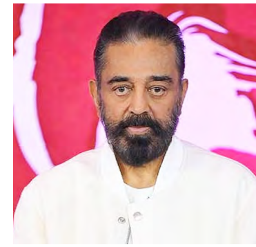
எதிர்க்கட்சியாகச் செயல்படுவோம்” என்று அறிவித்திருக்கிறார். அவரது அரசியல் முதிர்ச்சியை நான் மதிக்கிறேன். இப்போது அரசியலமைப்பு பொறுப்பில் இருப்பவர்களும் அதே கடமையை நிறைவேற்ற வேண்டும். இது கோரிக்கை அல்ல, அவர்களின் அரசியலமைப்புக் கடமைக்கான நினைவுட்டல்.

சென்னை: மே.8- “விஜய் தலைமையிலான தமிழக வெற்றிக்கடி கழகம் 108 இடங்களில் வென்றுள்ளது. அவரை ஆட்சியமைக்க அழைக்காமல் இருப்பது தமிழ்நாடு மக்களின் ஆணையை அவமதிப்பதாகும்” என்று கமல்ஹாசன் தெரிவித்துள்ளார். இது தொடர்பாக மக்கள் நீதி மயத்தின் தலைவர் கமல்ஹாசன் வெளியிட்டுள்ள எக்ஸ் பதிவில், “தமிழ்நாடு சட்டமன்றத் தேர்தலில் ஆட்சியமைக்கும் அதிகாரத்தை மக்கள் எந்தக் கட்சிக்கும் வழங்கவில்லை. இந்த ஆளுநர் வரலாற்றில் முன்னெப்போதும் நிகழாதது. எனது சகோதரர் மு.க. ஸ்டாலின், ‘மக்கள் தீர்ப்பை மதிக்கிறோம்; பொறுப்பான