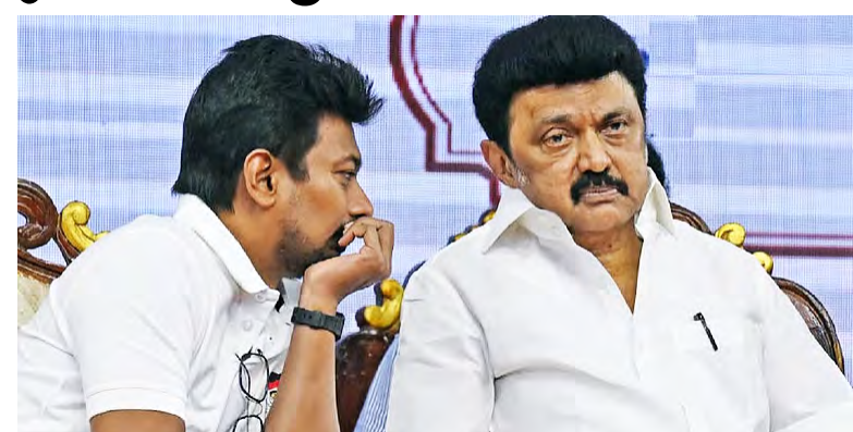
பேசப்பட்டதாகவும் ‘சோர்ஸ்’ தகவல்கள் தீயாய் பரவத் தொடங்கின. இப்படி பகீர் திட்டத்தோடு திராவிட கட்சிகள் திகிலூட்டுவதற்கு ரோடு போடுகிறார்கள் என நேஷனல் மீடியா லெவலில் இரவு முழுக்க உருட்டுகள் உலவின. இதற்கு இடையில், பதுங்குவதற்கு சிறந்த இடம் என புதுச்சேரியை செலக் செய்து, பெரிய கட்சிகளோட எம்எல்ஏக்களை பேசும் பண்ணிக்காததாகவும் அதிரடி தகவல்கள் பரவின. இவையெல்லாம் உருட்டுகளால் உண்மையாக என்பது குறித்து இதுவரை திமுகவும் அதிமுகவும் அதிகாரபூர்வமாக வாயே திறக்கவில்லை. விஜய்யும் காங்கிரஸ் பக்கம் சாய்ந்ததால், இந்த சோர்ஸ் தகவல் நகர்வுகளையெல்லாம் சைலன்ஸ் மேடோடி அணுக ஆரம்பித்துவிட்டதாம் பாஜக டெல்லி மேலிடம். அதேவேளையில், தவெகவுக்கு பெரும்பான்மை கிடைக்காத நிலை நிலவுவதால், அரசு அமைப்பதற்கு ஆதரவு கோரி அதிமுக தரப்பு திமுகவிடம் மறைமுகமான

சென்னை: மே.8- அதிமுகவுடன் இணைந்து கூட்டணி ஆட்சி அமைக்க திமுகவின் இரண்டாம் கட்டத் தலைவர்கள் வலியுறுத்தி வருவதாக கூறப்படும் நிலையில், இது தொடர்பாக கூட்டணி கட்சிகளுடன் திமுக தலைவர் மு.க.ஸ்டாலின் இன்று ஆலோசனை மேற்கொண்டார். நடந்து முடிந்த சட்டப்பேரவைத் தேர்தலில் எந்தக் கட்சிக்கும் பெரும்பான்மை இல்லாத நிலையில், தனிப்பெரும் கட்சி என்ற அடிப்படையில் ஆட்சி அமைக்க தவெக முயன்று வருகிறது. இது தொடர்பாக அக்கட்சியின் தலைவர் விஜய் நேற்றும் இன்றும் ஆளுநரைச் சந்தித்து ஆலோசனை மேற்கொண்டார். மேலும், ஆட்சி அமைக்க அழைப்பு விடுக்கக் கோரி கடிதமும் அளித்தார். எனினும், பெரும்பான்மை பலம் இருப்பதை உறுதிப்படுத்துமாறு ஆளுநர் விஜய்யிடம் தெரிவித்துள்ளார். பெரும்பான்மை பலம் இருப்பது உறுதிப்படுத்தப்படாமல் மட்டுமே, ஆட்சி அமைக்க உரிமை கோரும் கடிதத்தின் மீது பரிசீலனை மேற்கொள்ள முடியும் என்றும் அவர் கூறியுள்ளார். இந்தச் சூழலில்தான், அதிமுக திமுக கூட்டணி வியூகம் தொடர்பாக திரைப்படம் போன்ற தகவல்கள் புகழ்கிழமை இரவு பரவ ஆரம்பித்தது. அதிமுக ஆட்சியமைக்க உள்ளதாகவும், எடப்பாடி பழனிசாமி முதல்வர் ஆவார் என்றும், திமுக வெளியில் இருந்து ஆதரவளிக்கும் என்றும் தகவல்கள் வெளியானது. ‘ஆட்சியில் நீ பாதி... நான் பாதி’ என்றெல்லாம் இல்