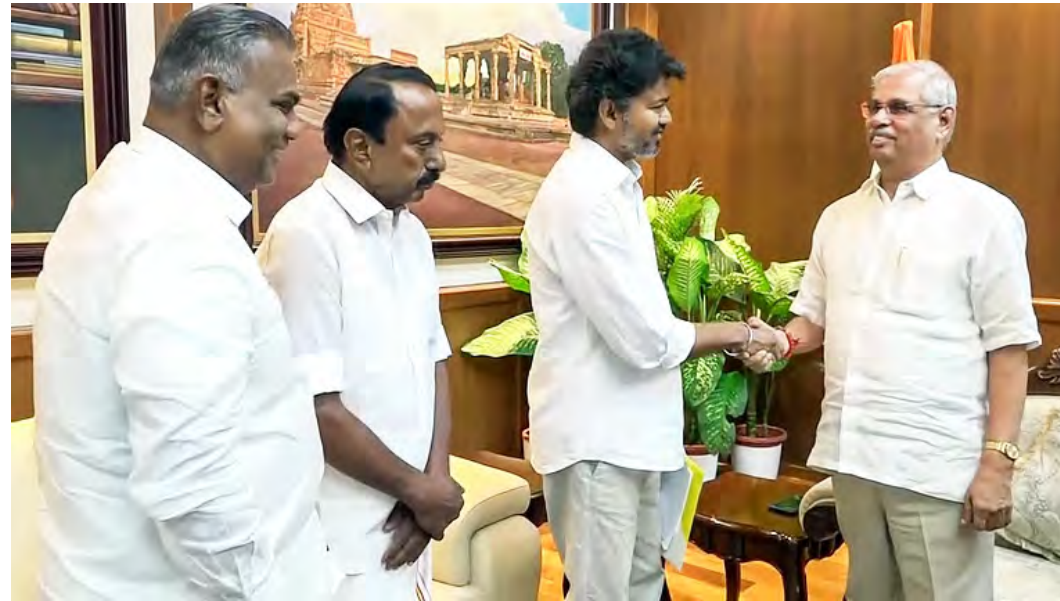
தலைவர் விஜய்யை ஆளுநர் மாளிகைக்கு அழைத்திருந்தார். அந்தச் சந்திப்பின்போது,

ஆளுநர் மாளிகைக்குச் சென்று சந்தித்தார். இந்த சந்திப்பு 30 நிமிடங்களுக்கு மேலாக நடந்தது. இதனால் தமிழக அரசியல் களத்தில் பரபரப்பு ஏற்பட்டது. ஆளுநர் ஆட்சி அமைக்க அழைப்பு விடுத்தார் என்றும் பின்னர் இல்லை என்றும் மாறி மாறி செய்திகள் வெளியாகின. தவெக தரப்பும் சந்திப்பு பற்றி ஏதும் சொல்லவில்லை. இந்நிலையில், இந்த சந்திப்பு தொடர்பாக ஆளுநர் மாளிகை அறிக்கை வெளியிட்டுள்ளது. அந்த அறிக்கையில்: “தமிழக ஆளுநர் ராஜேந்திர விஸ்வநாத் அர்லேகர், இன்று தவெக