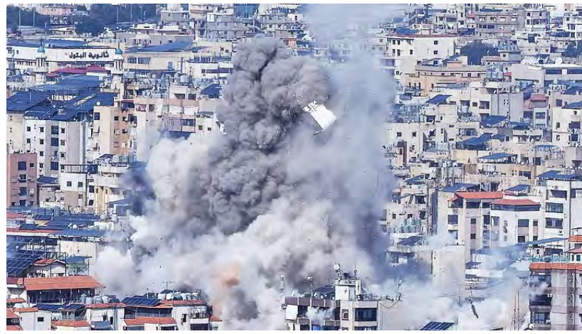
இந்த நிலையில், ஈரான் காமேனி கூறியதாவது; ஹார்முல் உச்ச தலைவர் மொஜ்தபா ஜலசந்திக்கான புதிய சட்டவிலகளை

டெல்லி, மே.3- அமெரிக்கா ஈரான் இடையேயான போர் மீண்டும் தொடங்கும் சூழல் நிலவுவதாக ஈரான் ராணுவம் எச்சரிக்கை விடுத்துள்ளது. அமெரிக்கா எந்த ஒரு உடன்படிக்கையையோ அல்லது ஒப்பந்தத்தையோ மதிப்பதில்லை, ஏதேனும் முட்டாள்தனமான செயலில் ஈடுபட முயன்றால் அதை எதிர்கொள்ள முழுத் தயார் நிலையில் இருப்பதாகவும் ஈரான் ராணுவம் தெரிவித்துள்ளது. அணுசக்தி விவகாரத்தில் ஈரான் மீது அமெரிக்கா இஸ்ரேல் இணைந்து தாக்குதல் தொடங்கிய போரில் தற்காலிக சண்டை நிறுத்தம் அமலில் உள்ளது.