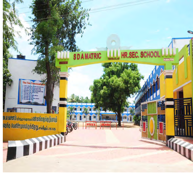
ஆசிரியர்கள் மற்றும் நிர்வாகப் பணியாளர்கள் சம்பந்தத்தில் பணியிட மாற்றம் செய்யப்பட்டதாக கூறப்படுகிறது.