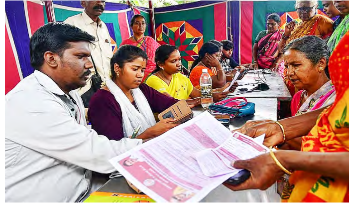
செய்ய அரசுக்கு உரிய கால அவகாசம் தேவைப்படுகிறது. மே 2026 மாதத்திற்கான கலைஞர் மகளிர் உரிமைத் தொகை, பயனாளிகளின் வங்கிக் கணக்கில் விரைவில் நேரடியாக வரவு வைக்கப்படும் எனத் தெரிவிக்கப்பட்டுள்ளது.

இது தொடர்பாக தமிழக அரசு வெளியிட்டுள்ள அறிக்கையில், “மே 2026 மாதத்திற்கான கலைஞர் மகளிர் உரிமைத் தொகை பயனாளிகளின் வங்கிக் கணக்கில் விரைவில் வரவு வைக்கப்படும். பெண்களுக்கு மாதந்தோறும் ரூ.1000/ உரிமைத் தொகையாக வழங்கப்பட்டு வரும் கலைஞர் மகளிர் உரிமைத்தொகைத் திட்டத்தினை மறுசீரமைப்பு