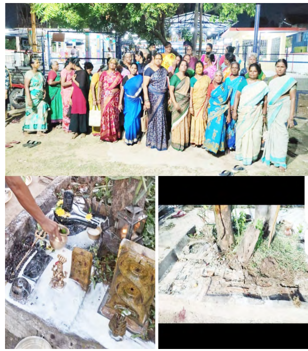
காலை பூஜைக்காக உட்பட 5 சிலைகள் வந்தபோது சிவன் சிலை காணாமல் போனது

கீழ்க்கட்டளை மே.15- செங்கல்பட்டு மாவட்டம், பல்லாவரம் தொகுதிக்குட்பட்ட கீழ்க்கட்டளை செல்லியம்மன் கோவில் தெருவில் அமைந்துள்ள திரௌபதி அம்மன், ஸ்ரீ மாரியம்மன் மற்றும் பெரியபாளையத்து ஸ்ரீ பவானி அம்மன் ஆலயத்தில் பரபரப்பு சம்பவம் ஏற்பட்டுள்ளது. இந்த ஆலயத்தில் கடந்த சுமார் 4 ஆண்டுகளாக சிவன் சிலை உள்ளிட்ட 5 சிலைகள் வைத்து பராமரித்து கும்பாபிஷேகமும் செய்து பக்தர்கள் வழிபட்டு வந்துள்ளனர். இந்நிலையில் குறியீற்றுக்கிழமை இரவு வழக்கம்போல் பூஜை நடத்திவிட்டு சென்ற நிலையில், திங்கட்கிழமை