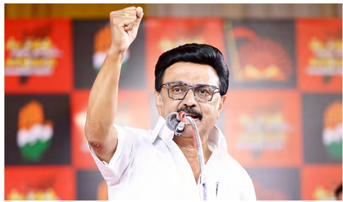
சொல்லி பரப்புரை செய்யத் தயாரா? நிதி ஒதுக்கீட்டில் தமிழ்நாட்டுக்குத் தருவது எவ்வளவு? பாஜகவால்

சென்னை: ஏப்.7- தமிழ்நாட்டுக்கு வரும் ஒன்றிய பாஜக அமைச்சர்களும், பாஜக முதல்வர்களும் இந்தக் கேள்விகளுக்கு பதில் சொல்வார்களா? "தமிழ் மண்ணில் நின்று, மும்மொழிக் கொள்கையை அமல்படுத்துவோம் என்று சொல்லி பரப்புரை செய்யத் தயாரா? கிறிஸ்தவத் தொண்டு நிறுவனங்கள் மீது தாக்குதல் தொடுக்கும் FCRA சட்டத்திருத்தத்தை திரும்பப் பெறுவீர்களா?, நிதி ஒதுக்கீட்டில் நிதி கிடக்குமா? என முதல்வர் ஸ்டாலின் கேள்வி எழுப்பியுள்ளார்.