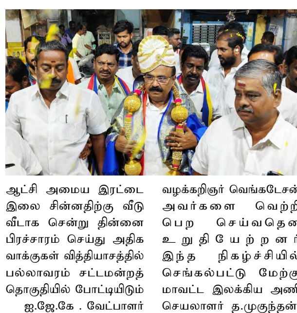
ஆட்சி அமைய இரட்டை இலை சின்னத்திற்கு வீடு வீடாக சென்று திண்ணை பிரச்சாரம் செய்து அதிக வாக்குகள் வித்தியாசத்தில் பல்லாவரம் சட்டமன்றத் தொகுதியில் போட்டியிடும் ஐ.ஜே.கே. வேட்பாளர்