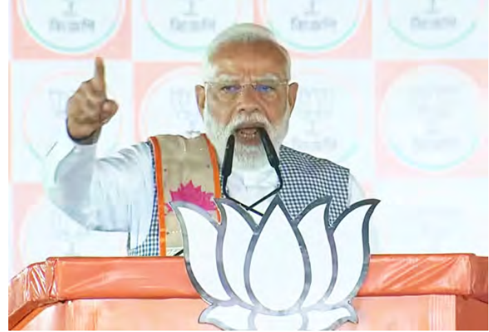
பதவியேற்பு விழாவிற்கு திரும்புவேன். பாஜ ஆட்சி அமைக்கும்.

பதவியேற்பு விழாவுக்கு. நேர்மையான ஆட்சியை மக்கள் விரும்புகின்றனர். இதுவே மேற்குவங்கத்தில் கடைசி பிரசார நிகழ்வு. மே 4ம் தேதிக்கு பிறகு பாஜவின்