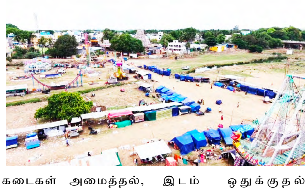
கடைகள் அமைத்தல், இடம் ஒதுக்குதல்

மற்றும் வாடகை வசூல் செய்தல் போன்ற நடவடிக்கைகளுக்கு சம்பந்தப்பட்ட துறையின் முன் அனுமதி பெறப்பட வேண்டும் என்பது விதிமுறையாகும். ஆனால், மானாமதுரை சித்திரை திருவிழாவில் நகராட்சி நிர்வாகம் வசூல் செய்யும் கட்டணத்திற்கு பொதுப்பணி துறை அல்லது மாவட்ட நிர்வாகத்தின் அனுமதி பெறப்பட்டுள்ளது என்பது குறித்து தெளிவான தகவல் வெளியாகவில்லை. இதனால், "விழா காலங்களில் மட்டும் என்ற பெயரில் நகராட்சி நிர்வாகம் கட்டணம் வசூலிப்பது