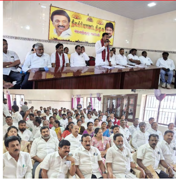
வரலாற்று சிறப்புமிக்க வெற்றி பெறுவது குறித்து ஆலோசிக்கப்பட்டது.

சட்டமன்ற தேர்தலில் உதகை, குன்னூர், கூடலூர், தொகுதிகளில்