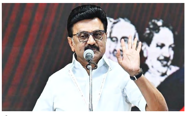
சொன்னதைச் செய்யும் திமுக அரசு, சொல்லாத திட்டங்களையும் நிறைவேற்றியுள்ளது.

சென்னை: மார்ச்.23- திமுக அரசின் சாதனைகளையும், அதனால் தமிழகத்தில் உள்ள ஒவ்வொரு குடும்பத்தினருக்கும் கிடைத்துள்ள பயன்களையும் இடைவிடாது பிரச்சாரம் செய்யும் பணியை ஒவ்வொருவரும் மேற்கொள்ள வேண்டும் என்று திமுக தொண்டர்களுக்கு முதல்வர் ஸ்டாலின் கடிதம் எழுதியுள்ளார். இது தொடர்பாக அவர் நேற்று எழுதிய கடிதத்தில் கூறியிருப்பதாவது: