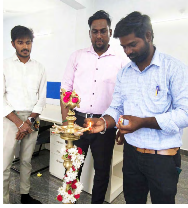
திருவண்ணாமலை நகரில் செயல்படும் இந்த

தமிழ்நாடு மற்றும் குஜராத் மாநிலங்களில் ஒரே நாளில் 19 புதிய கிளைகளைத் தொடங்கும் நிறுவனத்தின் விரிவாக்கத்திட்டத்தின் ஒரு பகுதியாக இந்த கிளை திறக்கப்பட்டுள்ளது.