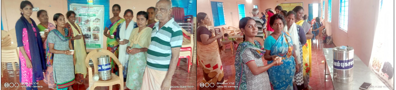
■ சிவகங்கை மாவட்டம் மானாமதுரை அரசு மருத்துவமனையில் உள்ள சித்த மருத்துவமனை பிரிவு சார்பில் இன்று (நவ23) மானாமதுரை குலாலர் தெருவில் உள்ள மண்பாண்ட தொழிலாளர்களுக்கு நிலவேம்பு கசாயம் வழங்கினார்கள். இந்நிகழ்வில் சித்த மருத்துவ பிரிவு மருத்துவர்கள், செவியர்கள் மண்பாண்ட தொழிலாளர்கள் ஆகியோர் கலந்து கொண்டனர்..

ஏற்பாடு செய்திருந்தோம். விளையாட்டு போட்டிகளில் பங்கேற்ற அனைத்து மாணவ மாணவர்களும் தங்களை திறமைகளை வெளிப்படுத்தினர். இப்போட்டியில் கலந்து கொண்டு அனைத்து பள்ளி நிர்வாகத்துக்கும் ஆசிரியர்களுக்கும் மாணவ மாணவியர்களுக்கும், வெற்றி பெற்ற மாணவ மாணவியர்களுக்கும் கல்லூரி சார்பாக வாழ்த்துக்களை தெரிவித்துக்கொள்கிறோம் என்று தெரிவித்தனர். இதில் பங்கேற்ற பள்ளி ஆசிரியர்கள் கல்லூரி வழங்கிய வரவேற்பு, ஒழுங்கமைப்பு மற்றும் வசதிகளை பாராட்டினர். உற்சாகம் நிரம்பிய முறையில் வெற்றிகரமாக யுவ ஆடுகளம் விழா நிறைவடைந்தது. இந்நிகழ்ச்சியில் கல்லூரி ஆசிரியர்கள் மாணவர்கள் உட்பட ஆயிரத்துக்கும் மேற்பட்டோர் கலந்து கொண்டனர்.