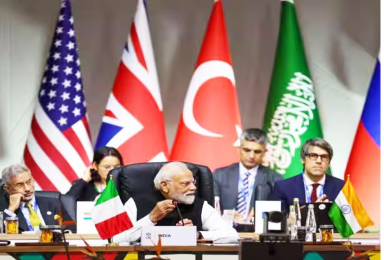
இல்லை. இந்த கூட்டம் 3 நாடுகளின் குழுக்கள் கூட்டம் அல்ல. மாறாக, 3 பெரிய ஜனநாயக நாடுகள் மற்றும்

ஜோகன்னஸ்பர்க்: நவ.24- ஐ.நா.வில் சீர்திருத்தங்கள் என்பது இனி கட்டாயம் என்று பிரதமர் மோடி வலியுறுத்தி உள்ளார். தென் ஆப்ரிக்காவின் ஜோகன்னஸ்பர்க்கில் இந்தியா, பிரேசில், தென் ஆப்ரிக்கா தலைவர்கள் கூட்டம் நடைபெற்றது. இதில் பிரதமர் மோடி கலந்து கொண்டார். கூட்டத்தில் அவர் பேசியதாவது: உலக நாடுகள் மத்தியில் பயங்கரவாத எதிர்ப்பு நடவடிக்கைகளில் ஒருங்கிணைப்பு என்பது தேவை. இங்கு பயங்கரவாதத்தை எதிர்த்து செயல்படுவதில் இரட்டை நிலைப்பாடு என்பதற்கு இடமே