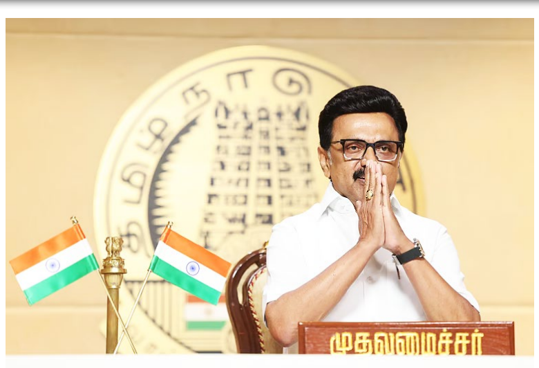
மாவட்டம் மொடக்குறிச்சி திறந்து வைக்கிறார். அதைத் ஜெயராமபுரத்தில் மாவீரன் தொடர்ந்து தீரன் சின்னமலை பொல்லான் திருவுருவச் சிலைமண்டபம் சென்று, அவரது திருவுருவச் சிலைக்கு மலர்தூவி

சென்னை, நவ.23- நவம்பர் 25 கோவையிலும், நவம்பர் 26 ஈரோட்டிலும் முதல்வர் மு.க.ஸ்டாலின் கள ஆய்வு மேற்கொள்ள இருக்கிறார். இது குறித்து அரசு சார்பில் வெளியிடப்பட்டுள்ள அறிக்கையில், “தமிழக முதல்வர் ஸ்டாலின் கள ஆய்வுப் பணிகளுக்காக கோவை, ஈரோடு மாவட்டங்களுக்கு நவ.25, 26 ஆகிய இரண்டு நாட்கள் சுற்றுப்பயணம் மேற்கொள்கிறார். நவ. 25 அன்று காலை கோவையில் செம்மொழிப் பூங்காவை திறந்துவைக்கிறார். மாலையில் தொழில்துறை சார்பில் பல்வேறு தொழில் நிறுவனங்களுடன் நடைபெறும் பிரிந்துணர்வு ஒப்பந்த நிகழ்ச்சியில் பங்கேற்கிறார். நவ.26 அன்று காலை ஈரோடு