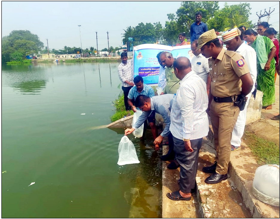
இராமநாதபுரம் மாவட்டம், இராமநாதபுரம் ஊராட்சி ஒன்றியம், கீழ்க்கோட்டை ஊராட்சி, இடையார்வலசை கிராமத்தில்