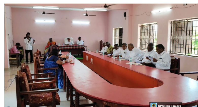
தடுப்பதற்கு நடவடிக்கை எடுக்க வேண்டும்.

2. பிபேருராட்சி பகுதிகளில் நடவடிக்கை எடுக்க வேண்டும்.