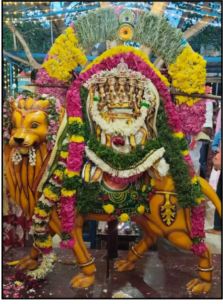
நிகழ்ச்சிகளையும் விழா குழுவினர் வெகு சிறப்பாக ஏற்பாடு செய்திருந்தனர் என்பது குறிப்பிடத்தக்கது.

அதனை தொடர்ந்து ஸ்ரீ பஞ்சமுக விநாயகருக்கு வெள்ளி அங்கி அணிவிக்கப்பட்டது இன்றிக்ஷுவில் கேவில் நிர்வாகிகள் மற்றும் உறுப்பினர்கள் அனைவரும் கலந்து கொண்டு சிறப்பித்ததுடன் மஹா தீபாராதனை,சிறப்பு அன்னதானம் மற்றும் உற்சவமூர்த்தி வீதி உலாவிலும் கலந்துகொண்டு விநாயகரின் அருளை பெற்றனர் மேலும் அனைத்து