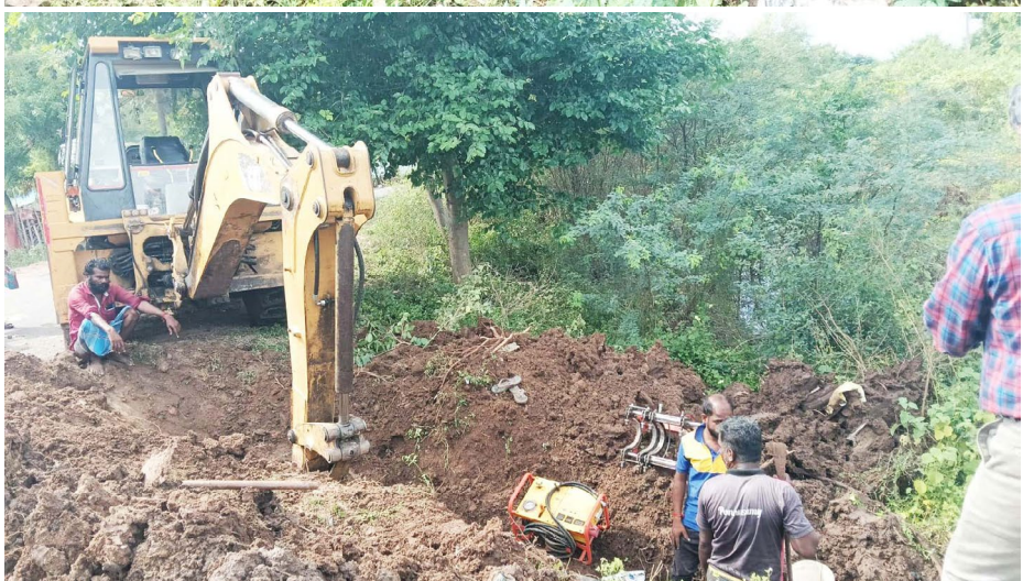
சிவகங்கை மாவட்டம் இளையான்குடி புதாரிலிருந்து குராணம் செல்லும் சாத்தனியில் கிராமத்தில் கூட்டுறவு வங்கி எதிரில் காவிரி கூட்டு குடிநீர் குழாயில் உடைப்பு ஏற்பட்டுள்ளதால் சாலைவழி நீர் வீணாக சென்றது இதுகுறித்து மாலை தந்தி நாளிதழின் செய்தி எதிரொலியாக தற்போது குடிநீர் குழாய் உடைப்பு சரி செய்யப்பட்டது. விவரவு நடவடிக்கை எடுத்த அதிகாரிகள் மற்றும் மாலை தந்தி நாளிதழிலுக்கு கிராம பொதுமக்கள் நன்றி தெரிவித்தனர்