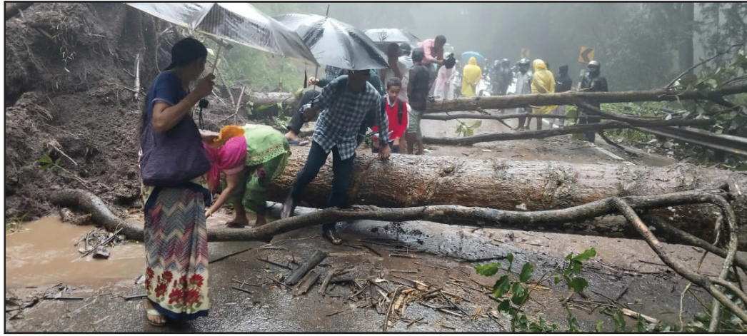
நெல்லை மாவட்டம் அதிகமழை காரணமாக மணிமுத்தாறு அருவி அருகே பாறை உருண்டு சாலை தண்டிப்பு. இதன் காரணமாக மாஞ்சோலைக்கு போக்குவரத்து துண்டிப்பு. பொதுமக்கள் அவதி.