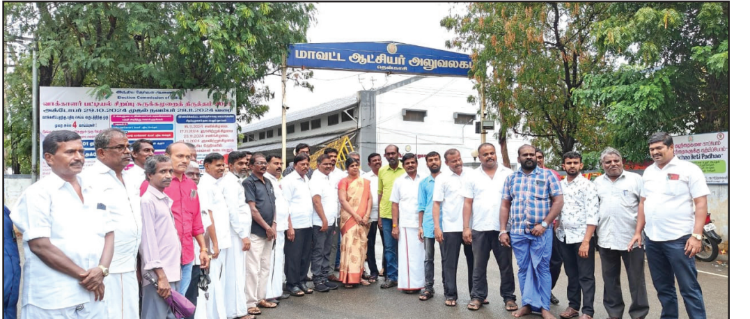
பாதை என அனைத்துமே அடைக்க கூடிய நிலை ஏற்பட்டுள்ளது.

தென்காசி திருநெல்வேலி நான்கு வழிச்சாலை திட்டப்பணி நடைபெற்று வரும் நிலையில் ஆலங்குளம் காவல் நிலையம் கீழ்ப்புறம் தற்போது பாலம் அமைக்கப்பட்டு வரும் நிலையில் அந்த பாலம் அருகே செல்லக்கூடிய சாலையை அடைத்து பாலம் கட்டுவதாகவும் இதனால் அரசு மற்றும் தனியார் பள்ளிகளுக்கு செல்லும் 3000 க்கும் மேற்பட்ட பள்ளி மாணவர்களை, புதுப்பட்டி கிராமத்திற்கு செல்லும் பாதை, நீதிமன்றத்திற்கு செல்லும்